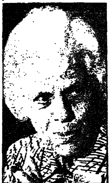
بلدية القدس تدي كوكيك خلال زيارتها لبلدية غزة في المدينة كما ستقوم والدة الرئيس الأمريكي خلال زيارتها لبلدات التي ستستمر...